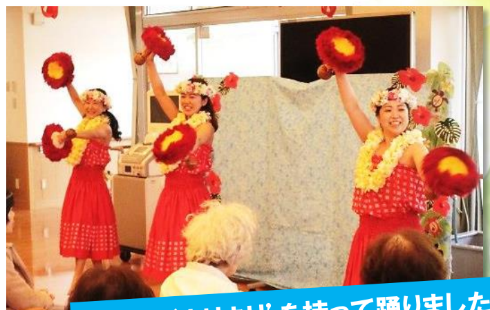
今回は‘ウリウリ’を持って踊りました