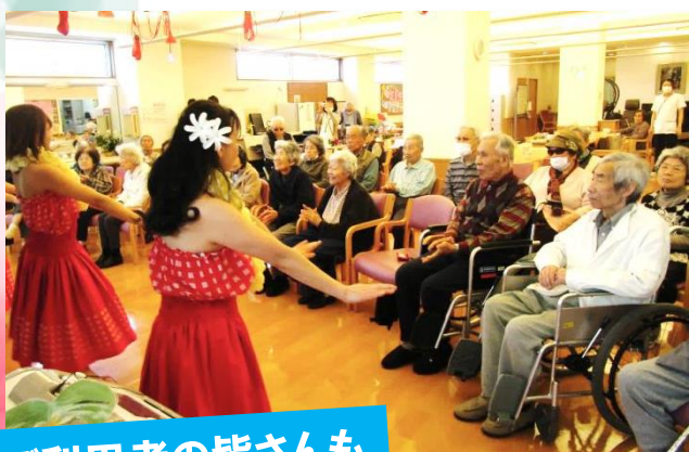
ご利用者の皆さんも 楽しんでいました