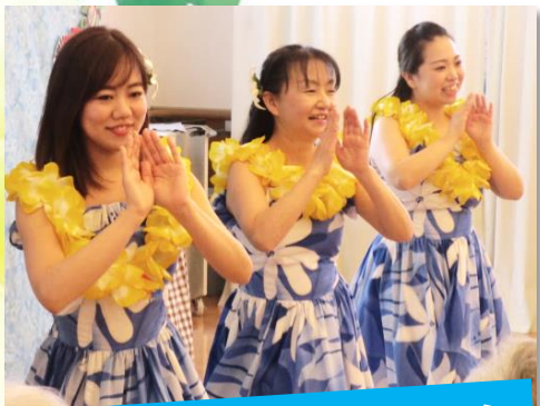
職員によるフラダンスチーム ‘ハレアカラ’